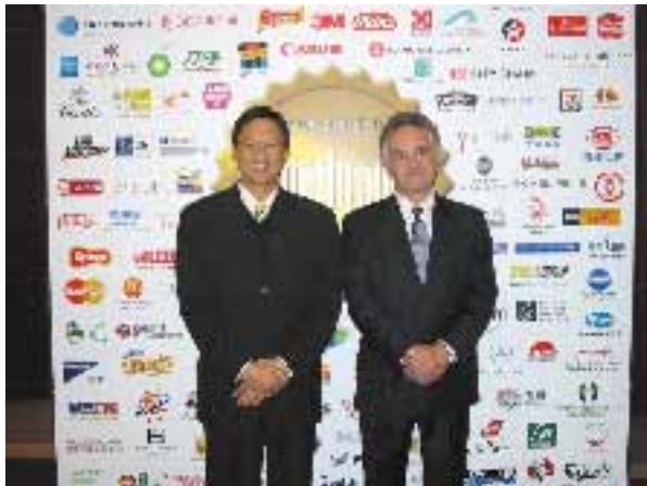
美聯物業為全港唯一榮獲香港超級品牌地產代理。

集團一向致力為客戶提供的優質服務,全面滲透各區域,得到廣大市民支持,業務迅速發展,分行網絡遍佈