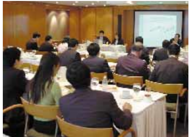
作為行業翹楚，以及唯一上市地產代理，屢獲基金及證券公司邀請，巡迴路演分析行業及樓市發展。

二零零三年二月鴻運地產宣布清盤，集團曾考慮作出收購，以增加市場佔有率。鴻運結業標誌著行業出現結構性變化，中型代理行難以競爭，只有規模大如美聯的大型代理才可發揮網絡效應，逆市中仍能穩健經營。物業成交金額自一九九七年起持續萎縮，不少地產代理公司均面對沉重的資金壓力，而集團在逆市中發揮上市功能，所發行的認股權證在二零零三年一月到期，認