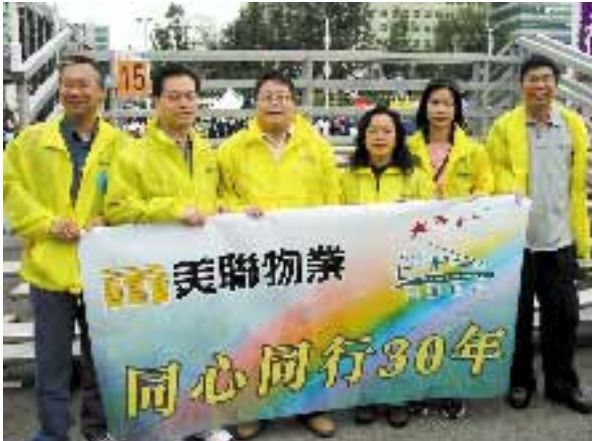
美聯熱心公益，去年管理層及一眾員工便參與慈善步行。

不過，短期樓市仍受制於供過於求，估計發展商會採取薄利多銷策略，故樓價仍有一定壓力。而外圍局勢緊張及非典型肺炎肆虐，亦對香港樓市產生短期負面影響。集團期望政府能儘快控制肺炎擴散，令整體經濟活動早日回復正常。