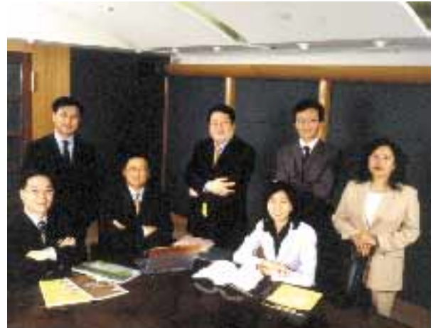
集團匯聚人才,管理層推動行業發展不遺餘力。

全港,以至國內各大城市。榮獲「超級品牌」後,集團取得更多市場信心,進一步奠定在業界中首屈一指的領導地位。